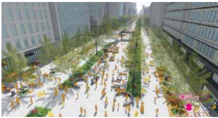
図-4 将来イメージ