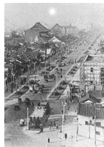
写真-1 開通当時の御堂筋 (昭和12年頃)

しかし、バブル崩壊以降、関西経済は苦境に立たされた。グローバルな情報交流を行う国際会議の開催件数は、平成9年に関東が関西を追い抜き、国内における人・モノ・資金・企業・情報の東京一極集中が進行、さらに製造拠点の海外