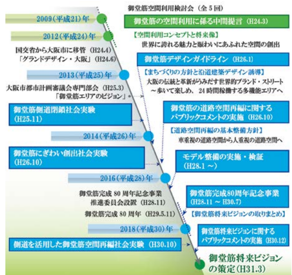
図-2 道路空間の再編に向けた検討経緯

その実現に向けたファーストステップとして側道部分の歩行空間化に取り組んでおり、現在、整備効果に加え、側道閉鎖に伴う渋滞や荷捌きなど、周辺地域に与える影響などを慎重に検証しながら、万博までには千日前通りから長堀通りまでの約1kmの開通を目指し整備を進めている。