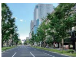
図-7 淀屋橋～本町イメージ