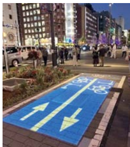
写真-5 御堂筋チャレンジ

具体的には、万博時のシイドレッシングや万博のおもてなし環境づくりを目指した花飾り等の設置を行った。また、最先端技術の展開として、人とモビリティの共存を目指した新たなモビリティの走行実験のほか、国土交通省においても、DX・GX技術の有効活用による道路での電力の自給自足、歩行者・自転車等の交通整流化・走行快適性の向上を目的としたプロジェクションマッピングなどの実証実験を行った。さらに、高質な道路空間の実現に向け、滞留空間のにぎわい創出に向けたマルシェ等の開催、歩行空間のさらなる魅力向上を目指したベンチ設置や沿道植栽の高質化、放置自転車の「リアルタイム撤去」にも取り組んだ。