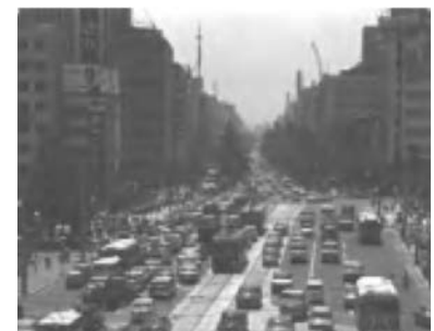
写真-2 交通混雑する御堂筋 (昭和40年頃)