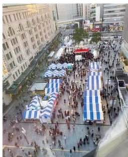
写真-6 なんば広場オープン

御堂筋の南端に位置するなんば駅前では、平成20年に民間発意で人中心の駅前広場の創出プロジェクトが動き出し、平成27年12月に、地元・経済界・行政による検討体制として「なんば駅前広場空間利用検討会」が立ち上げられた。バス・タクシー乗り場の再配置による周辺交通への影響や、商店街での荷さばき活動への影響について検証するため、2回にわたる道路空間の再編と滞留空間創出の社会実験を実施した。これら社会実験で得られた検証結果をもとに計画案の改良が重ねられ、必要な安全対策等を進めたのち、昨年11月23日に、以前は駅前ロータリーだった空間が、「なんば広場」としてオープンし、駅前に新たな賑わいスポットが誕生した。この「なんば広場」では、災害時の防災拠点としての活用も想定し、今後、まちづくり団体において、デジタルサイネージを活用した外国人向けの多言語化による災害情報の提供に向けた準備がなされることとなっている。