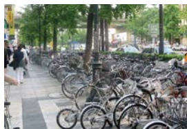
写真-3 放置自転車の状況 (平成21年頃)

側道部を閉じて歩行者空間を創ることの有効性について、一般市民、地元自治会、沿道事業者、運送事業者等を対象に意見聴取したところ、回答の半数以上がデメリットや不安を感じている結果となった。具体的には、側道を閉じた場合に、交通混雑の発生や荷捌き、タクシー利用客の乗降、客待ちができなくなることを懸念する意見が多く寄せられたほか、歩道部が広がることにより、放置自転車の増加や自転車のスピードが上がり危険性が増すなど、現状の問題点の悪化を懸念する声も上がった。自転車問題については、国と大阪市は喫緊の課題として、歩行者と自転車の共存に向けた市民協働による継続的な啓発活動を行った。