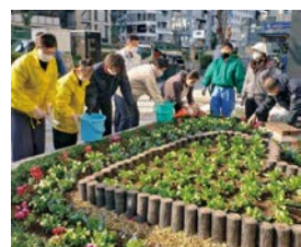
写真-4 エリアマネジメント団体による植栽活動

このうち、御堂筋本町北地区は、「大阪市都市景観条例」に基づく「地域景観づくり協定」において認定されたエリアマネジメント団体が、主体的に公告・サインのデザインや掲出方法のルールを定めており、設置には団体代表者への意見聴取を必要としている。また、他地区においてもエリアマネジメント団体がイベント活動や日常的な美化活動などを情報発信しながら、沿道敷地・道路空間の双方でより良い景観形成に向けて主体的に取り組んでおり、御堂筋の街路景観・まちなみの創造において官民共創のまちづくりが確立されてきている。